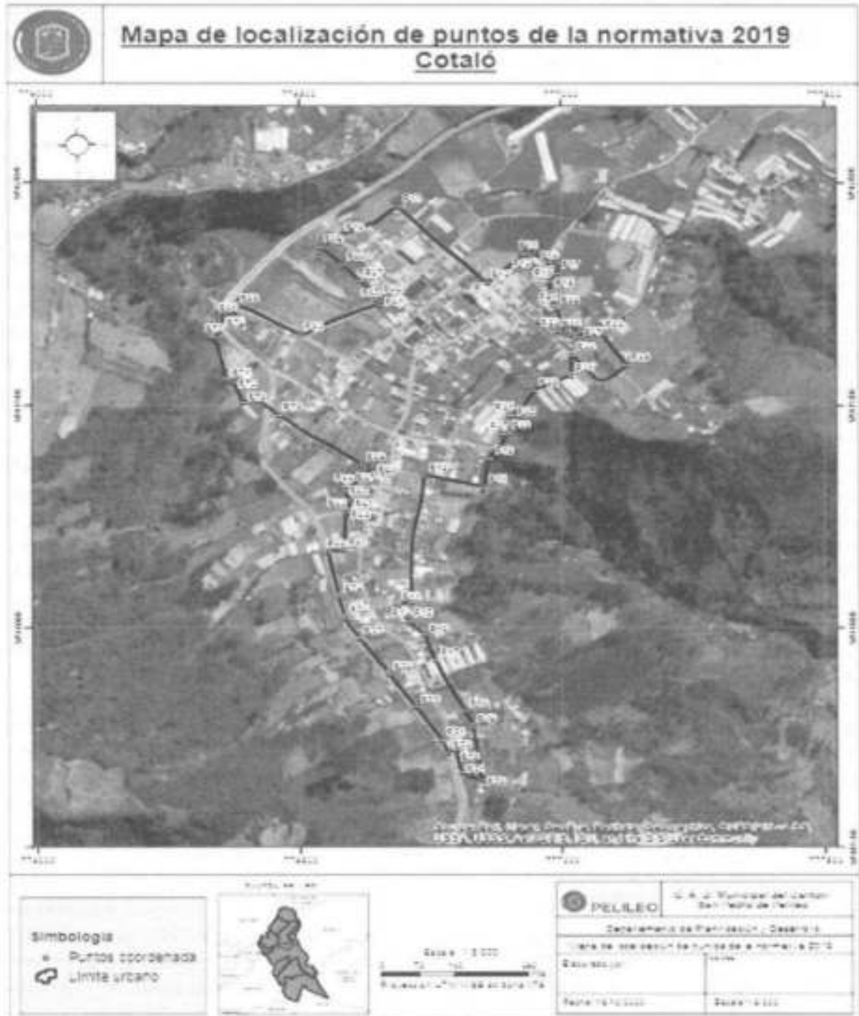
Imagen 1. Detalle de delimitación del centro poblado de la Cabecera Parroquial de Cotaló.

Las coordenadas son tomadas con el elipsoide de referencia: WGS 84 UTM zona 17 S.