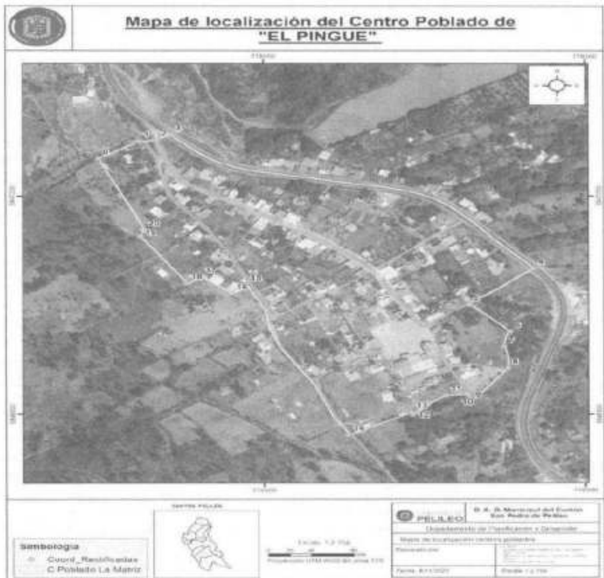
Imagen 1. Detalle de delimitación del centro poblado de El Pingue.

Las coordenadas son tomadas con el elipsoide de referencia: WGS 84 – UTM 17S